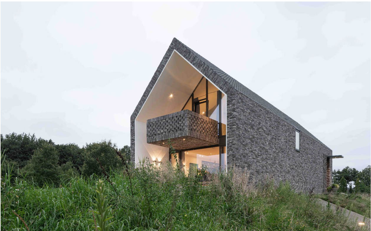
De oost is open om de ochtendzon te 'vangen', de noordgevel gesloten vanwege privacy richting naastgelegen woning