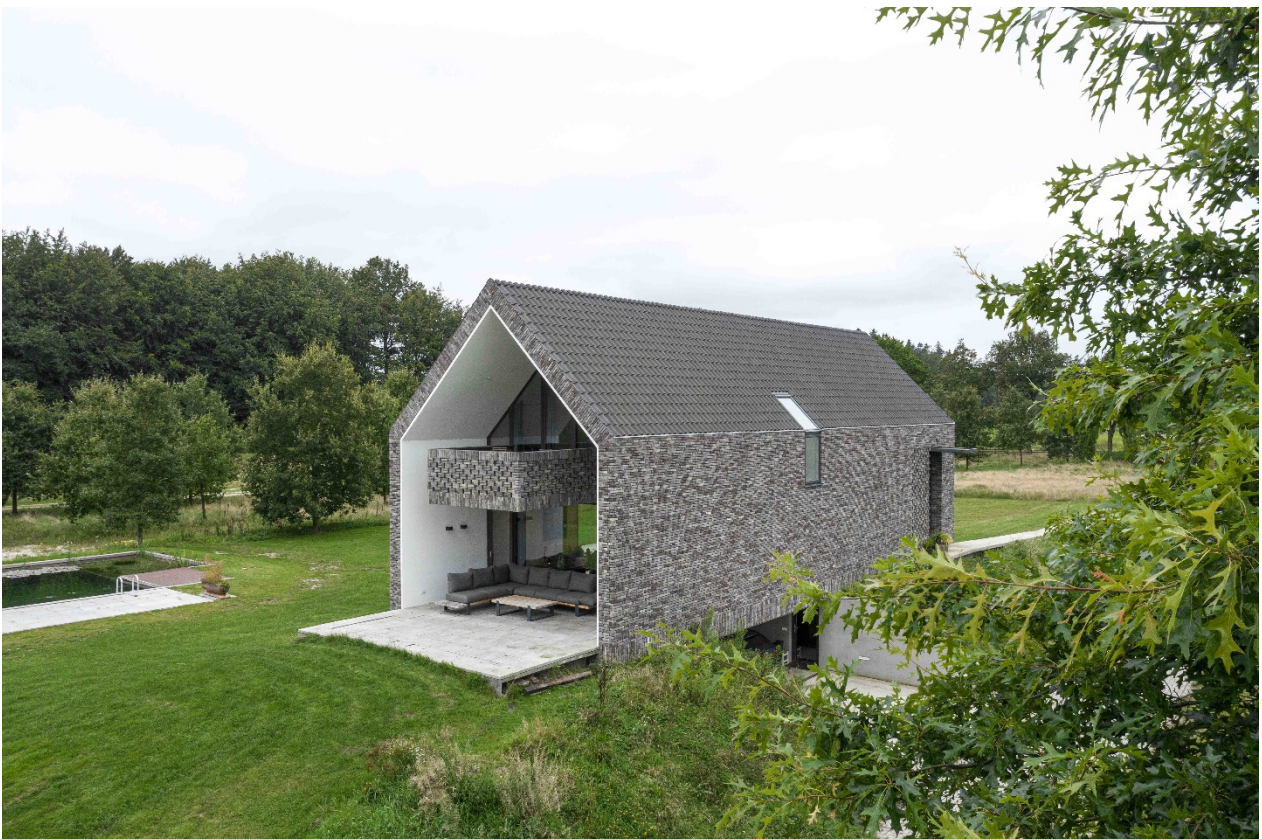
Onder de noordgevel de toegang tot de kelder waarin de auto's uit het zicht gestald kunnen worden