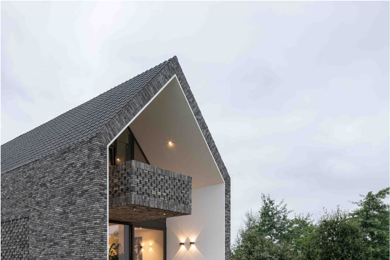
Het uitkragende balkon aan de oostgevel draagt bij aan de intimiteit op het ondergelegen terras