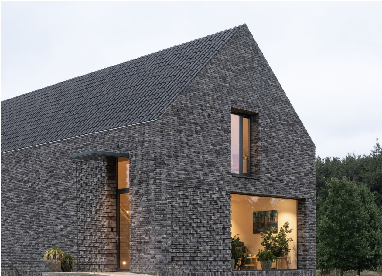
De westgevel en de entree in de noordgevel