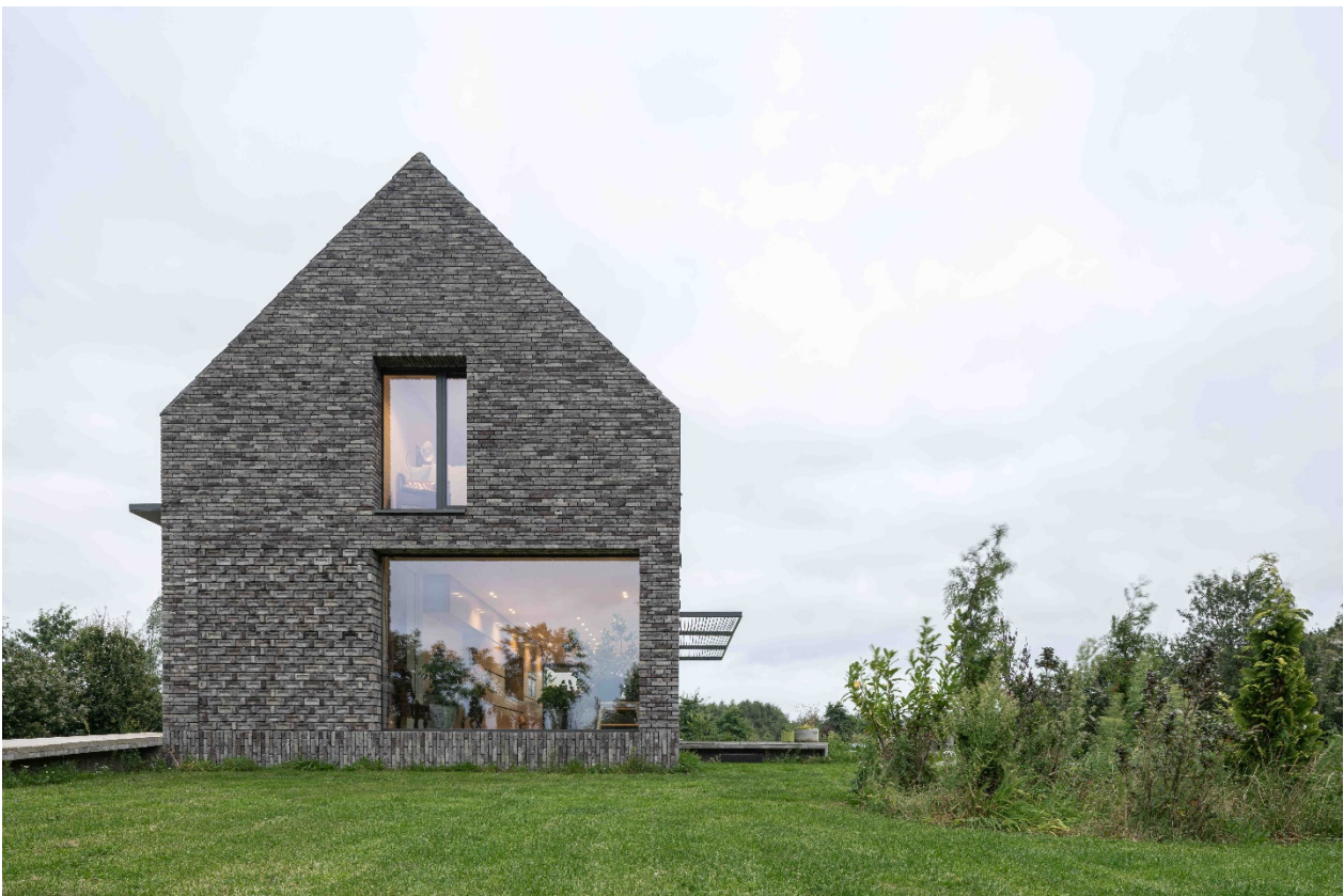
Het vlak met bijzonder metselwerk in de westgevel speelt een spel met de symmetrie